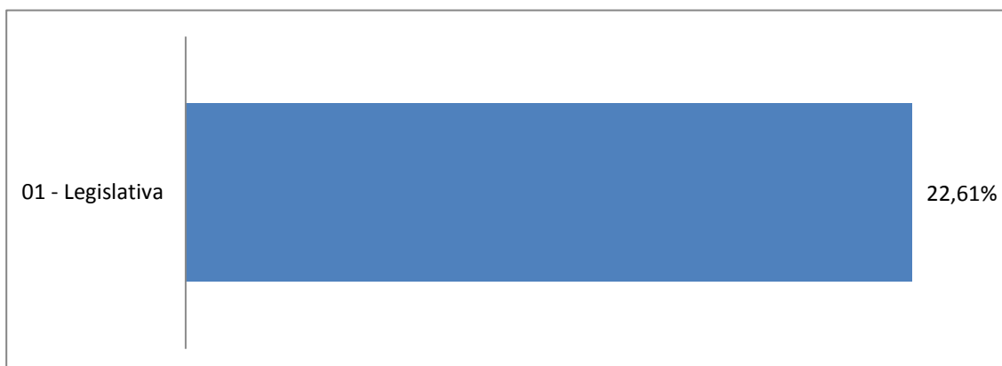
Gráfico 02 – Percentual Comprometido de Dotação Orçamentária por Função de Governo: 1º Quadrimestre

A análise entre despesa autorizada e executada configura-se importante, pois permite identificar quais funções foram priorizadas ou contingenciadas em relação à deliberação legislativa no tocante ao orçamento municipal. O gráfico seguinte demonstra o cotejamento entre as despesas autorizadas e executadas segundo as funções de governo. Trata-se de uma representação gráfica do quadro anterior.