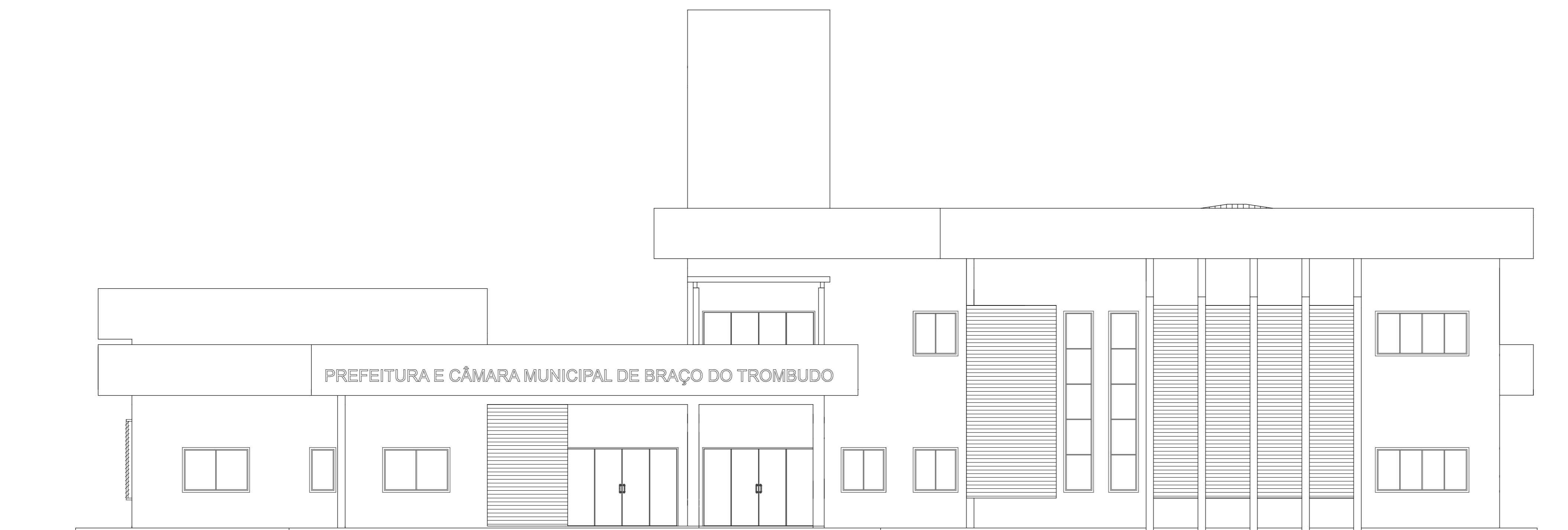
VISTA 01 ESC.: 1/75