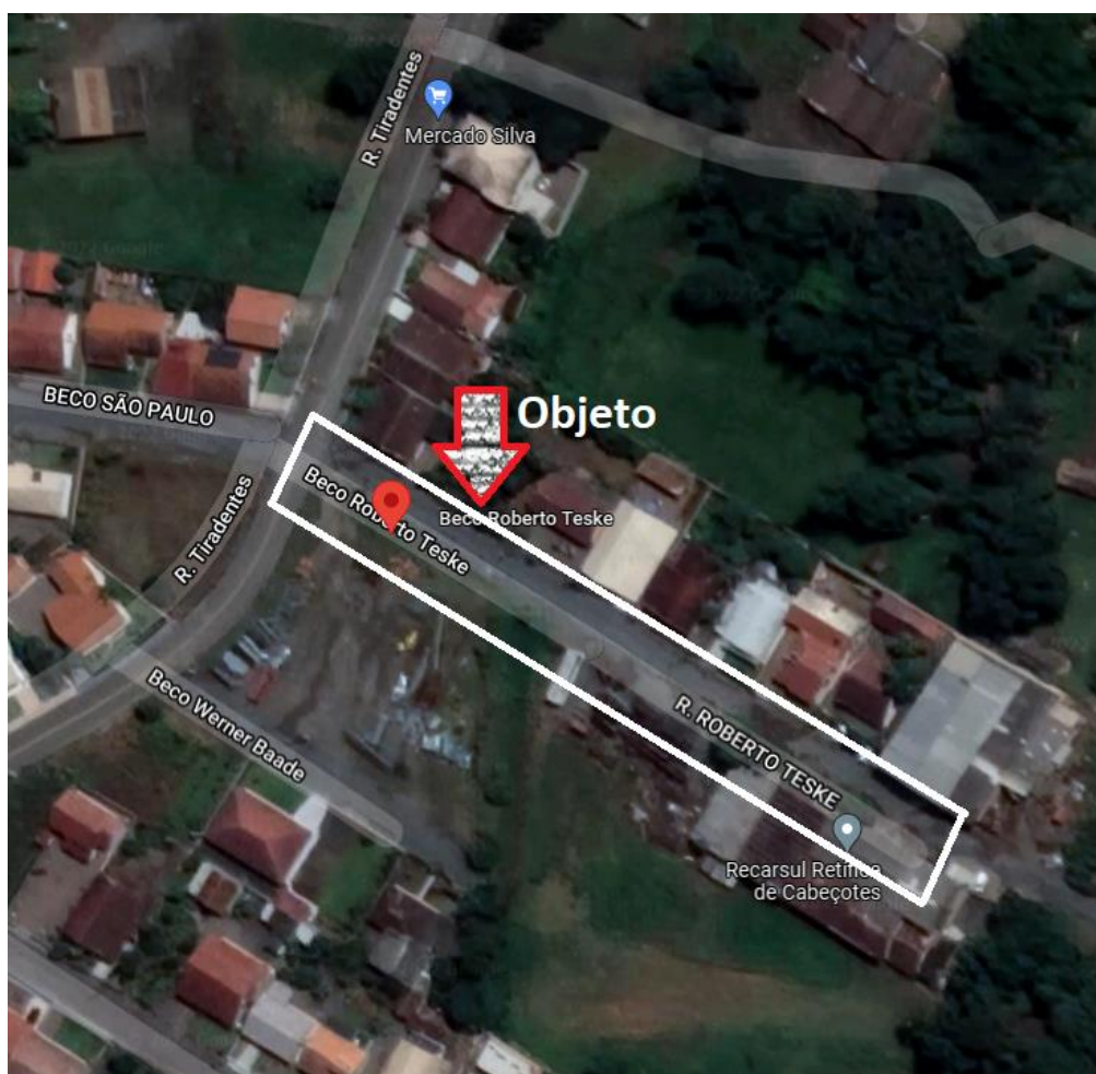
Fig 01 – Localização do objeto desse memorial descritivo.

A obra objeto desse memorial descritivo situa-se no BECO ROBERTO TESKE , bairro Centro, município de Braço do Trombudo/SC. O croqui de localização do objeto pode ser visto: