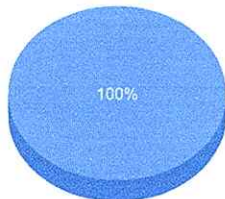
Quantidade de preços por item