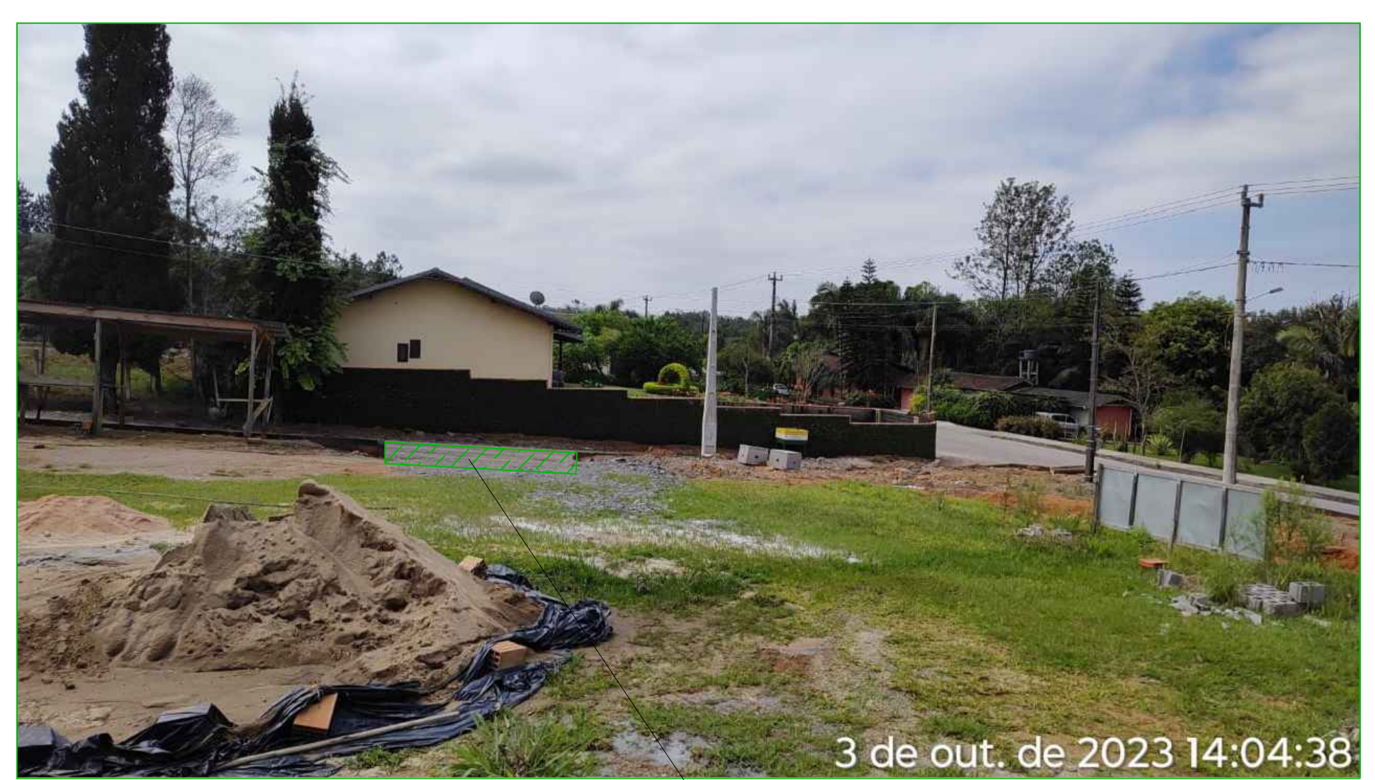
DETALHE BT - 01