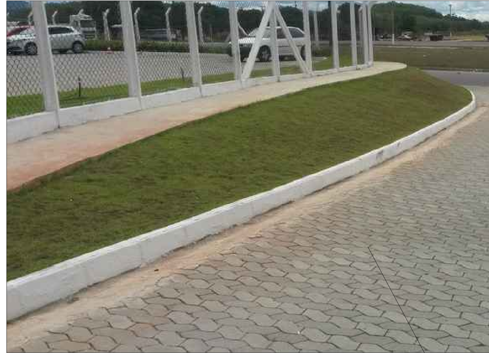
MODELO DE INSTALAÇÃO DE MEIO FIO Os meio fios arredondados e retos deverão ser instalados conforme indicado em projeto, deverão ser enterrados de forma a garantir estabilidade no terreno baldio para futuro gramado