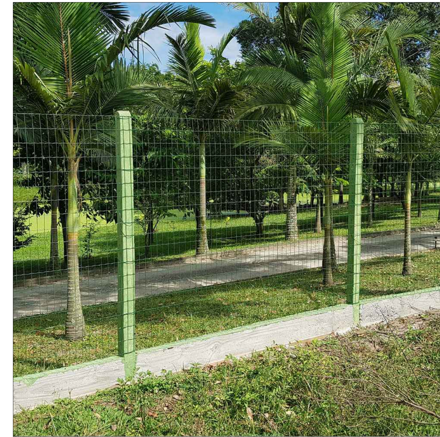
MODELO DE CERCAMENTO DO PERÍMETRO Mourões de concreto chumbados em viga baldrame Tela revestida em PVC cor a ser definida pela adm municipal Instalados no perímetro novo cemitério e em cima dos muros