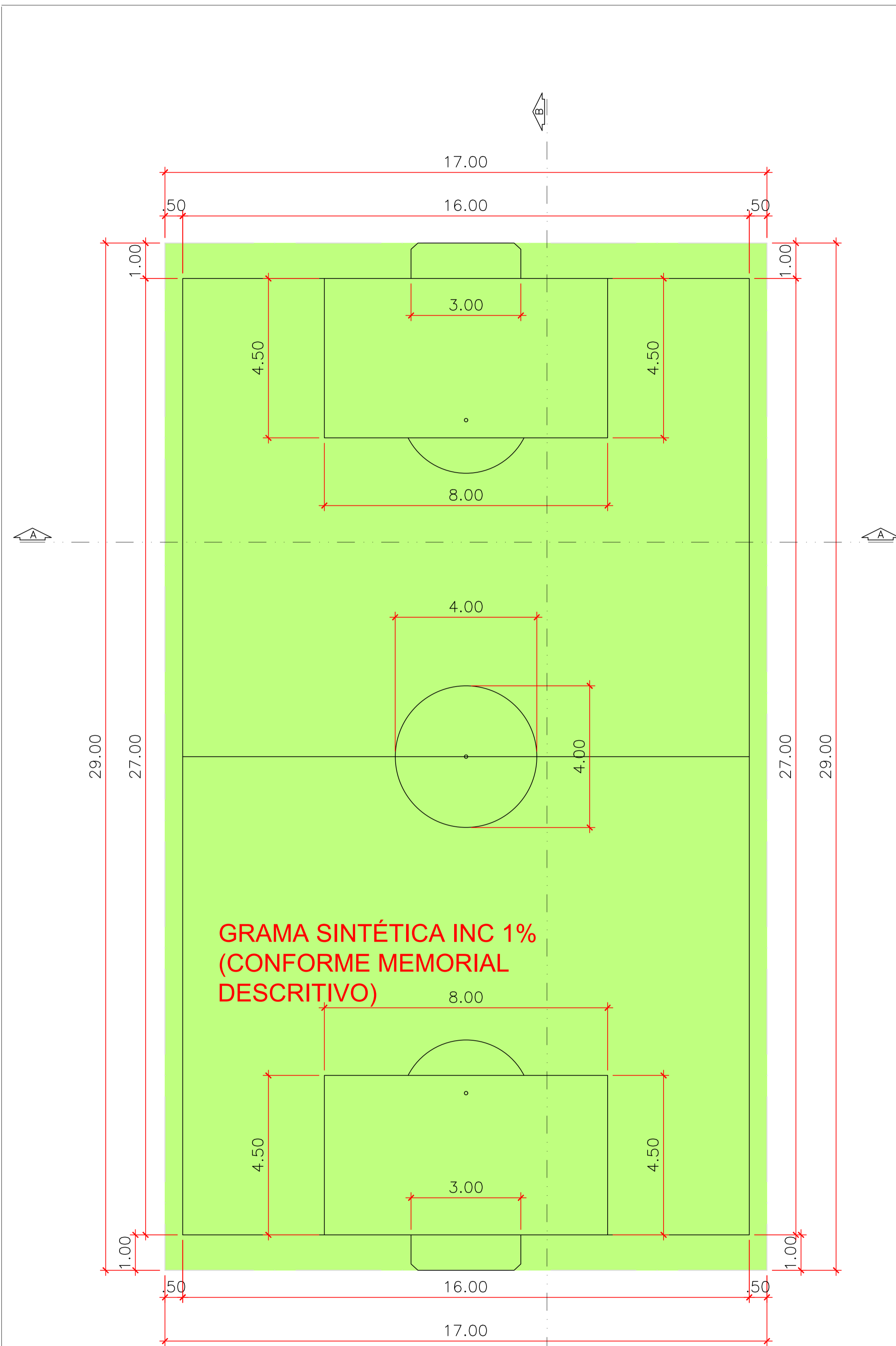
PLANTA BAIXA - COBERTURA ESCALA 1:75 Área Útil: 493,00m 2