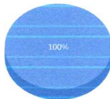
Quantidade de preços por item