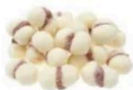
Biscoito Beijinho de Freira À Granel