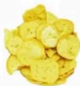
Provolone Crocante À Granel