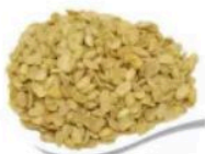
Soja Torrada Ervas Finas À Granel